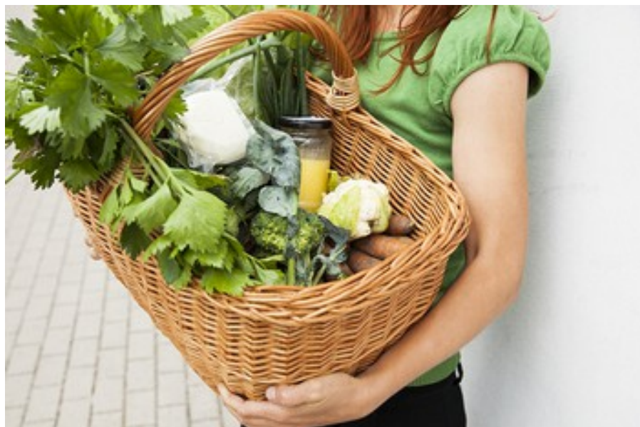
Projekts "REconomy", Ikšķiles Pārmaiņu iniciatīva

Tiešās pirkšanas kustības mērķis ir veicināt videi atbildīgu patēriņu, izglītot patērētājus par to, kādēļ ir būtiski izvēlēties vides slodzi mazinošus produktus un patēriņa veidu, tādēļ TP modeļi popularizējot grupas tiek aicinātas produktu pamatklāstā izvēlēties tikai vietējo, sertificēto biolauksaimnieku produktus. Grupas biedrus vieno kopīgas pamatvērtības: pelna tikai zemnieks, iepirkumus grupai organizē brīvprātīgie dežuranti – katrs grupas biedrs regulāri dežurē, tāpat būtiska ir komunikācija ar zemnieku. Šāds iepirkuma modelis atbalsta tieši vietējo, bioloģisko lauksaimnieku, mazina “pārtikas jūdzes”, iepakojuma patēriņu (notiek organizēta taras atgriešana, zemnieki tiek izglītoti par videi draudzīgām iepakojuma alternatīvām), kā arī mazina pārtikas izmešanu, jo pirkumi netiek veikti impulsīvi, tiek novērtēta to augstvērtīgā izcelsme.