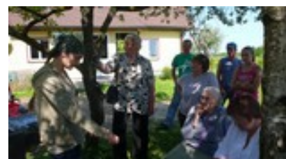
Solmu diņa (2011.gada maijs) - seminārs par permakultūras tehnikām Vārkavas novada Mazkursīšos