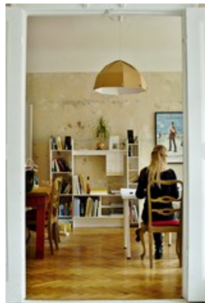
„DarbaVieta” mājgās telpas produktīvam darbam