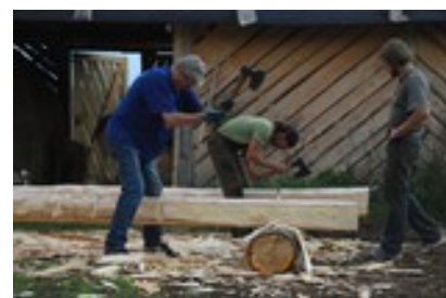
Slutes vīru jam session - amatnieku/namdaru prasmju skola Ameļu pagasta Putānos 2013.gada augustā

"Mēs esam pārliecinājušies, ka lēmumus jāpieņem cilvēkiem, kuri ir gatavi lēmumus realizēt..."