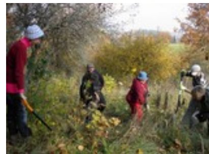
Saimes dārza stādīšanas talka - stādam plūškoku un irbenājus (2013.gada oktobris Ambeļos)

Biedrības darbs pēc būtības atbilst pārmaiņu iniciatīvai, lai gan pagaidām neesam reģistrēti pārmaiņu iniciatīvu tīklā.