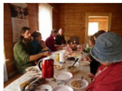
Pataļči pēc stādīšanas talkas (2013.gada oktobris Ambeļos)